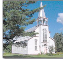
L'Église a été construite en 1906 et elle possède 2 jubés.

Bureau Touristique de La Minerve et de la Réserve faunique Papineau-Labelle 111 chemin des Fondateurs, La Minerve Qué. J0T 1S0 Info : 819 681-3380 poste 5545 www.municipalite.laminerve.qc.ca